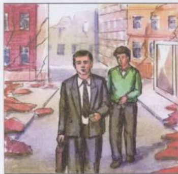
Держаться дальше от стен, заборов, столбов. Не входить в здания — толчки могут повториться