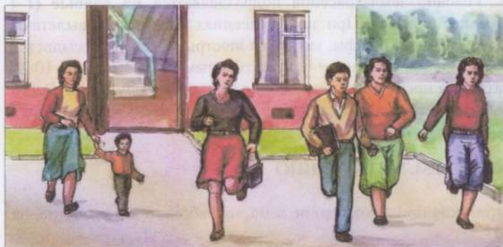
Быстро покинуть здание (в вашем распоряжении 15 — 20 секунд)

ПОЛУЧИВ ИНФОРМАЦИЮ ИЛИ ПОЧУВСТВОВАВ ПЕРВЫЕ ТОЛЧКИ, НЕОБХОДИМО: